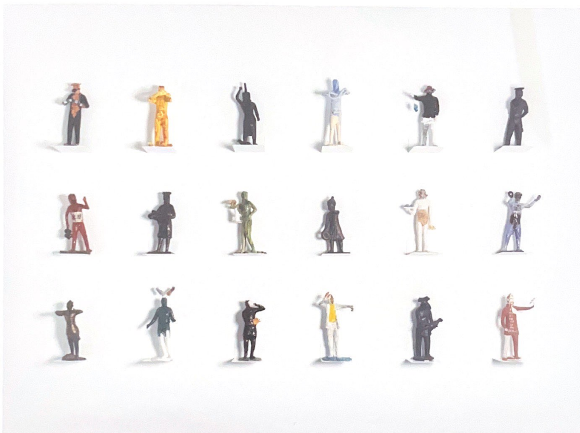
Votive Wall Paolo Porelli Italia 150x250x16 Terracota esmaltada y pintada