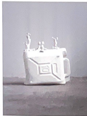
Paolo Polloniato Italia