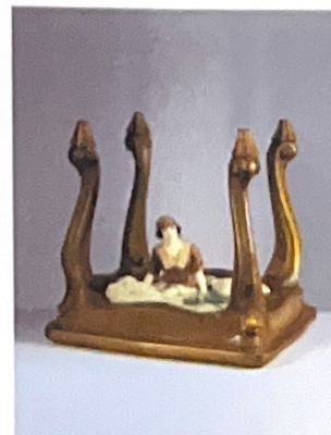
Serena Zanardi Italia