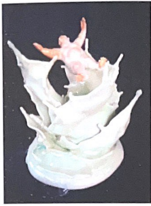
Yu Cheng Chung Taiwan