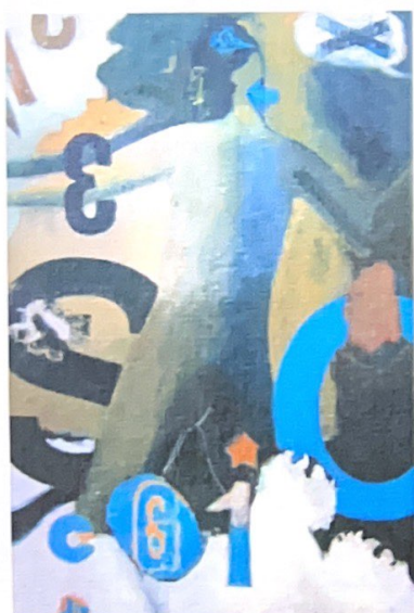
"Idolo d'occidente", 2005 - olio su tela 120x80

Paolo Porelli, pittore, scultore, ceramista, nato a Roma il 7 giugno 1966. Nel 1988, si diploma presso l'Accademia di Belle Arti di Roma, corso di pittura tenuto dal M° Enzo Brunori. Vive e lavora a Roma.