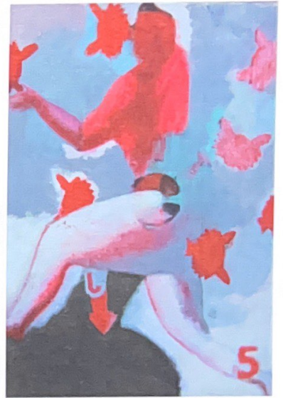
"Idolo diffusione di fuochi", 2005 - olio su tela 50x70