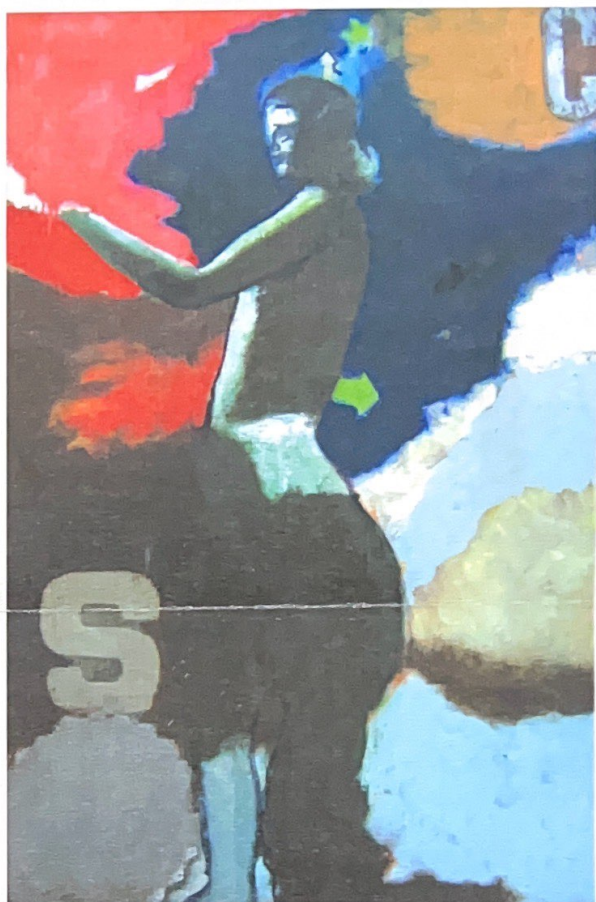
"Idolo del fuoco", 2005 - olio su tela 120x80

apocalisse ecologica. Accanto ci sono gli idoli della pubblicità e dell'informazione che propagandano e informano fino al condizionamento con sofisticate tecniche di persuasione. E infine al vertice del potere gli idoli della politica, fanatici sostenitori della democrazia, grandi manipolatori, maestri dell'inganno, che fanno della menzogna la loro più grande arte. Sotto la maschera della civiltà, del progresso e della libertà, questi idoli nascondono le loro miopi ed egoistiche ambizioni. Protagonisti pericolosi del nostro tempo, essi rappresentano il lato oscuro della civiltà tecnologica, quella forza sovvertitrice dell'ordine ecologico preesistente, che con uno processo dissociativo, altera gli indispensabili equilibri tradizionali dell'ambiente.