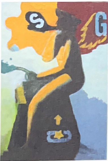
"Idolo del petrolio", 2005 - olio su tela 100x70